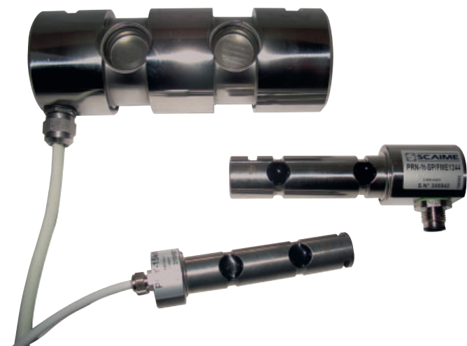
Câblage - Wiring