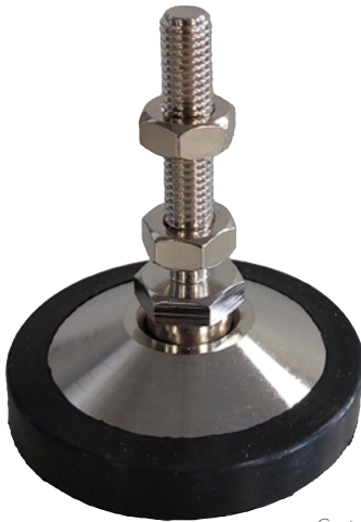
Capteur vendu séparément Load cell sold separately