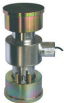
Kit de plaques - Plates kit